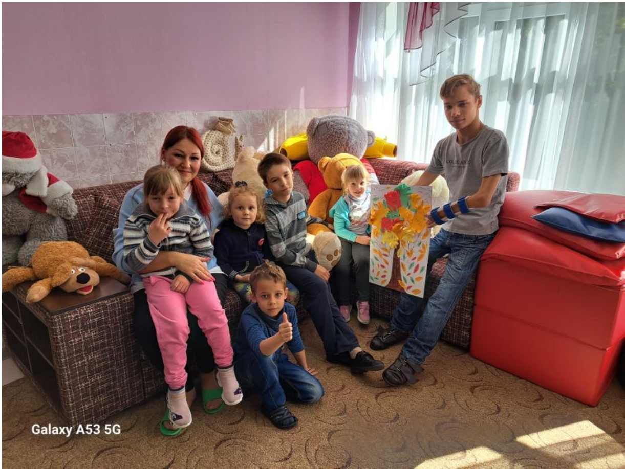
Galaxy A53 5G