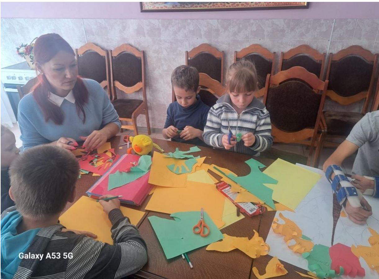
Galaxy A53 5G