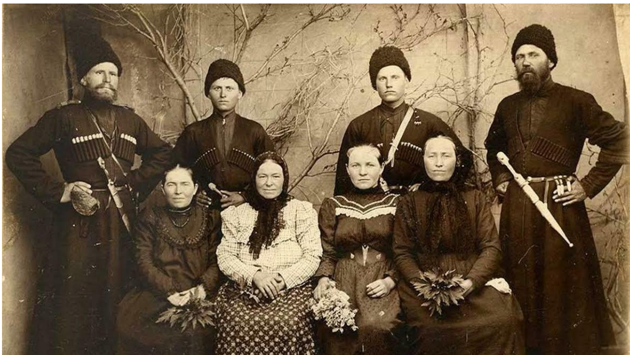
Семья терских казаков в XIX веке.

вания Ивана Грозного породил желание горцев селиться ближе к русским, с их цивилизацией, культурой и экономикой - т.е. по Тереку. Военные конфликты с Персией и особенно с Османской Империей привели к тому, что северокавказских горцев турки обращали в ислам и натравливали на русских. Новая волна казаков-переселенцев с Дона и Волги привела к появлению разных казачьих войск по Тереку, отличавшихся своими традициями и культурными особенностями.