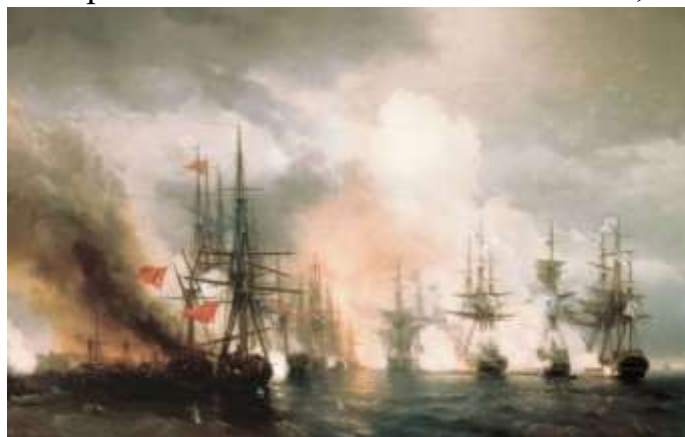
«Синопский бой». Картина художника Ивана Айвазовского, 1853 год

Но в том-то и ирония судьбы, что без этой победы Крымская война могла бы обернуться для России еще большими потерями.