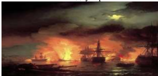
Чесменское сражение. Художник И. К. Айвазовский