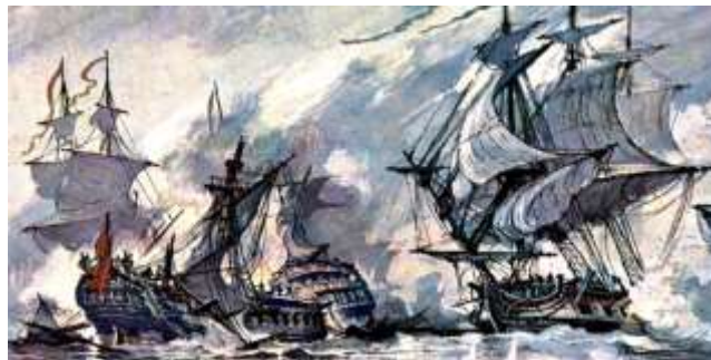
Патрасское морское сражение. И.Родионов