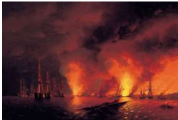
«Синопский бой 18 ноября 1853 года (Ночь после боя)». Картина художника Ивана Айвазовского, 1853 год

Погода в тот день тоже благоприятствовала русскому флоту: в косом дожде, который вскоре перешел в ливень, приближение нахимовской эскадры к Синопу на турецких кораблях заметили с опозданием.