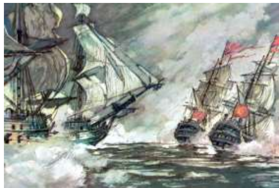
Картина «Морской бой в Керченском проливе». Художник И.И. Родинов

Около 5 часов вечера турецкие корабли стали выходить из боя. Ушаков преследовал их, при этом его флагманский корабль был впереди погони. Однако с наступлением темноты турецким кораблям удалось скрыться. Керченское сражение завершилось. Наши потери составили 29 убитых и 68 раненых. Потери турок были несоизмеримо больше, поскольку на их кораблях находился многочисленный десант. Ушаков поутру окончательно потерял турецкие корабли и вернулся в Севастополь. Турецкий флот, дойдя до своих баз, встал на ремонт и начал готовиться к реваншу