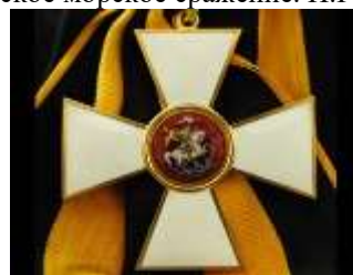
Орден Святого Георгия