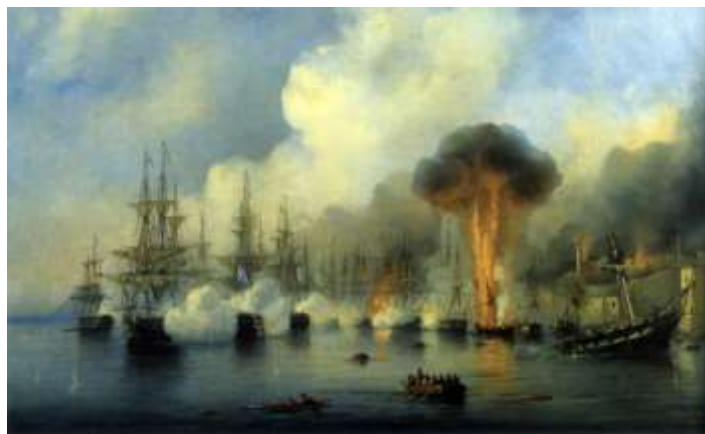
«Истребление турецкой эскадры адмирала Осман-паши при городе Синоп эскадрой Черноморского флота под командою начальника 5 й флотской дивизии вице-адмирала Нахимова, 18 ноября 1853 года».

Синопское сражение иногда называют и первой в истории битвой паровых кораблей, хотя это не совсем верно. Оно стало первым морским эскадренным боем, в котором с обеих сторон участвовали пароходы. А первое морское сражение с их участием случилось почти на месяц раньше, 4 ноября (23 октября по ст. ст.) 1853 года, когда русский пароход «Бессарабия», доставивший вице-адмиралу Нахимову сообщение о начале войны с Турцией, вступил в схватку с турецким пароходом «Меджари-Теджарет» и захватил его. От попавших в плен турок и стало известно о том, что эскадра адмирала Осман-паши, намеревающаяся атаковать Сухум-Кале и Потю, стоит в Синопе. Вскоре подтверждение этой информации поступило и от фрегата «Кагул», который двое суток уходил от турецкой погони и в итоге сумел оторваться от противника, доставив в Севастополь ценную информацию.