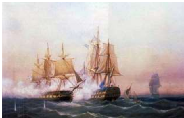
Захват фрегатом «Венус» шведского линейного корабля «Ретвизан»

Шведы потеряли 7 линейных кораблей («Финланд», «Гедвиг-Элизабет-Шарлотта», «Эмхейтен», «Ловиза Ульрика», «София Магдалена», «Эникхетен», «Ретвизан»), 3 фрегата («Камила», «Уппланд», «Земира»), около 32 малых судов, а также 4500 человек убитыми, ранеными и пленными. Потери русских составили 300 матросов.