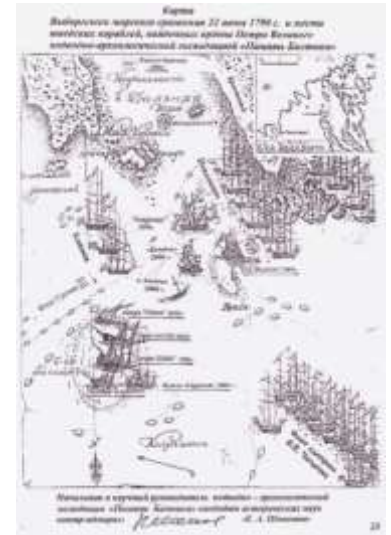
Ещё одна схема Выборгского сражения

В этот момент перед шведской линией появился «Константин», который тотчас же попал под продольный огонь, причем русский корабль в ответ мог стрелять только погонными пушками. На нем были сбиты две брам-стенги. Около 10.00 все пространство к западу от мыса Крюсерорт представляло собой поле боя.