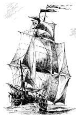
Корабль «Рождество Христово»

Однако капудан-паше удалось восстановить строй и наладить ответный огонь. Разгоревшийся с новой силой бой продолжался более двух часов. Турецкие моряки дрались с фанатизмом, но тут сказались лучшая подготовка русских бомбардиров, обрушивших всю мощь своей артиллерии на турецкие флагманские корабли. На контр-адмиральском корабле турок два раза возникал пожар. Сбитый артиллерийским огнем вице-адмиральский флаг был захвачен шлюпкой, спущенной с русского корабля «Св. Георгий».