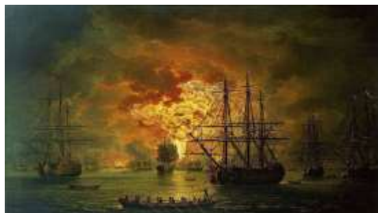
Разгром турецкого флота под Чесмой. Картина Якоба Филлипа Гаккерта