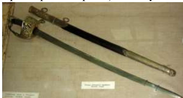
Личное оружие адмирала Осман-паши — палаш, ставший трофеем русских моряков и хранящийся в Музее Черноморского флота в Севастополе

Командовавший турецкой эскадрой адмирал Осман-паша был взят в плен и вернулся на родину только три года спустя, после окончания Крымской войны, навсегда оставив в Севастополе свое личное оружие – палаш (его сегодня можно увидеть в музее Черноморского флота). Но судьба пленника была гораздо завиднее судьбы почти