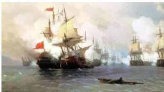
На картине Айвазовского изображён кульминационный момент боя - столкновение двух флагманов