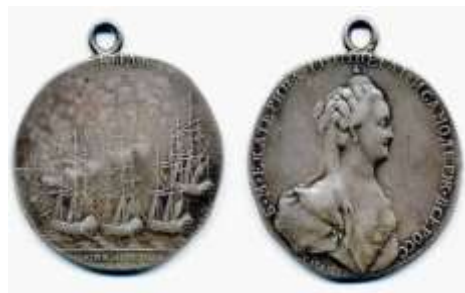
Медаль «В память сожжения при Чесме турецкого флота». 1770 г