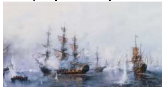
Русские фрегаты в бою

Лучше всего охарактеризовал весь этот бардак граф Салтыков в письме графу Безбородко: «Что делать, что наши морские витязи немножко созрели; это иначе и быть не может. Лета старые сопряжены с лишнею осторожностью. Оно для себя не худо; но для дела вообще – неуспешно. А к тому, ваше сиятельство, видите, что от несогласия и разногласия происходит; по пословице и выходит на правду – не слушайся ты старого, а слушайся бывалого. Вот бы мои батареи и в большую пользу были, потому что бы мы их сквозь строй провели и мало бы, надеюсь, прошло; но от несогласия ни одного, ни другого не успели. Я думаю, кто видел положение наших флотов, не скоро поверят, чтобы неприятель не токмо мог пройти, но как он мог и подумать этакое предприятие взять».