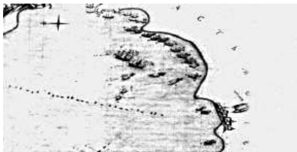
Карта Патрасского сражения 26-29 октября 1772 года.