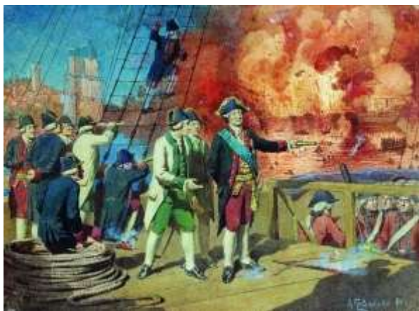
Уничтожение турецкого флота в Чесменском сражении. Алексей Кившенко

Русские эскадры стали полновластными хозяевами не только в Эгейском море, но и во всем восточном Средиземноморье. Они беспрепятственно перерезали турецкие коммуникации, блокировали пролив Дарданеллы и даже осуществили операцию по захвату важного порта Бейрут.