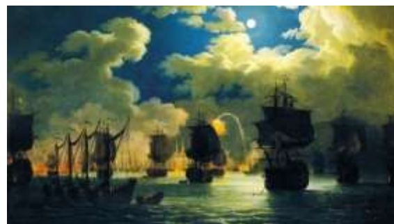
Начало боя у бухты Чесма в ночь на 26 июня 1770 года. Якоб Филипп Хаккерт

В течение 6 июля эскадра вела яростную артиллерийскую дуэль с турецкими кораблями, повредив нескольких из них. «От ударов пушек поверхность моря запылала», – османский историограф Ахмед Вассаф Эффенди.