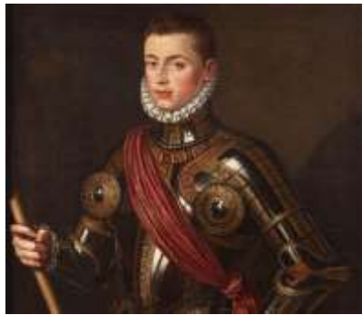
Неизвестный художник. Хуан Австрийский

Кроме моряков на каждом судне в обязательном порядке присутствовала абордажная команда. В ряды бойцов, помимо регулярной армии, принимали множество добровольцев разной национальности, готовых сражаться во имя веры.