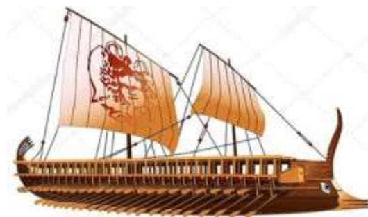
Современные изображения древнегреческих боевых и транспортных кораблей

Когда Фемистокл готовил флот для войны с персами, он прекрасно понимал, что афиняне вряд ли поддержат его решение. Ведь греки не считали серьёзной угрозой побеждённых под Марафоном варваров. Поэтому Фемистокл убедил сограждан, что мощный флот и новые корабли нужны для войны с Эгиной (этот остров вёл с Афинами непрерывную битву). Именно эта политика и привела в итоге к тому, что эллины выиграли Саламинское сражение.