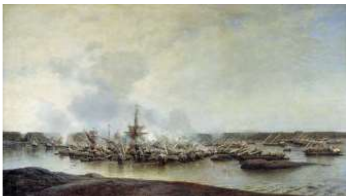
Гангутское сражение. С картины А.П. Боголюбова

В Гангутском морском сражении российскому флоту удалось полностью разбить шведов и стать полноправными хозяевами в Балтийском море.