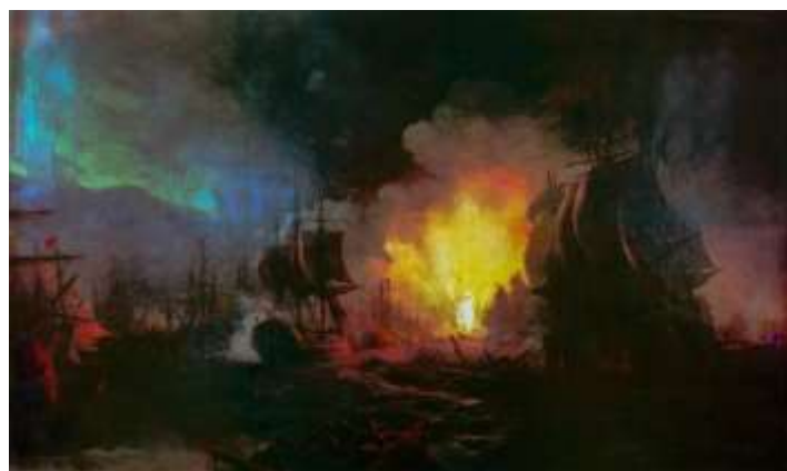
Чесменский бой. Иван Айвазовский

Не в последнюю очередь благодаря Чесменскому триумфу война против турок завершилась в 1774 году победой.