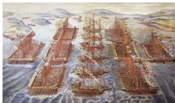
Неизвестный художник. Диспозиция войск

Видя, что центр вот-вот падет, отчаянный корсар Улуч Али, руководящий левым крылом, попытался помочь своему главнокомандующему и ударил во фланг флотилии Хуана Австрийского. Однако было поздно: Али-паша был уже мертв, и союзники теснили турок.