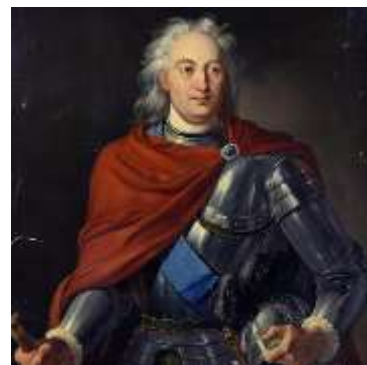
Генерал-адмирал Ф. М. Апраксин

Когда Апраксин на горизонте увидел шведскую эскадрилью, он решил отступить в Тверминнскую бухту, где оставался несколько недель. Он прекрасно понимал, что если бы он вступил в сражение с противником, то наверняка проиграл бы его.