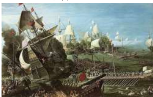
А. ван Эртвелт. Битва при Лепанто

Для Европы этот триумф стал значительнейшим достижением той эпохи. Сражение доказало, что непобедимых османов можно разбить. Эпическую битву при Лепанто еще долго воспевали в произведениях искусства и культуры.