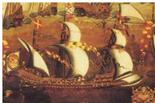
Неизвестный художник. Испанский галеас XVI века

К 1571 году союзникам удалось собрать неслыханный доселе флот. В него вошли военно-морские силы Испании, Венеции, Мальты, Генуи и других государств. Римский папа также прислал несколько галер. Общая численность флота составляла около трехсот кораблей, среди которых кроме галер, было шесть огромных венецианских галеаса. Воинов набралось примерно 80 тысяч.