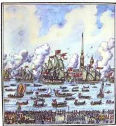
Валерий Прохвятилов «Гангутский бой»

Петр первый решил провести тактический маневр и разделить свои силы. Для этого был построен деревянный настил, длиной в 2,5 километра, по которому была перетащена часть галер с южного на северное побережье полуострова. Когда про это узнал командующий шведским флотом адмирал Ваттранг, он решил провести контр-меры, разделив свой флот и выслал отдельные отряды, которым ставилась задача уничтожить русских по частям.