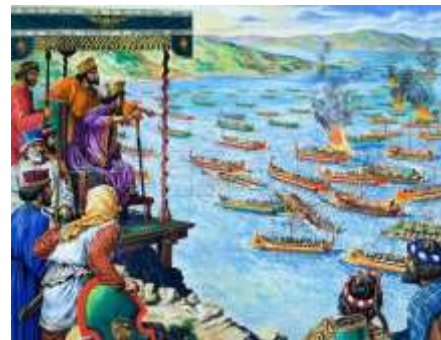
Адмирал Ксеркса наблюдает за ходом сражения

По всем канонам морского искусства, расположение греческого флота у острова Саламин было максимально неудобным. Корабли греков стояли в узком пространстве, оба выхода из которого легко контролировались противником. Развернуть триеры для битвы было негде, да и отступить в случае атаки некуда.