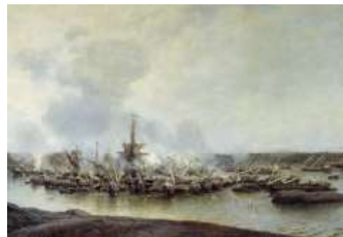
Полотно Алексея Боголюбова «Сражение при Гангуте 27 июля 1714 г.»

В 1995 году Государственная Дума Российской Федерации приняла закон «О днях воинской славы России». В этом нормативно-правовом документе установлены даты знаменательных побед российского оружия, которые должны почитаться в Российской Федерации. Первая победа русского флота также вошла в список знаменательных дат и 9 августа теперь является днем воинской славы и победы русского флота в Гангутском сражении.