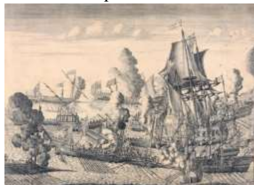
А. Ф. Зубов «Сражение при Гангуте»

Это решение стало его очередной ошибкой, так как, по сути, он сам открыл прибрежный фарватер и способствовал воссоединению галер Апраксина с флотилией Петра 1.