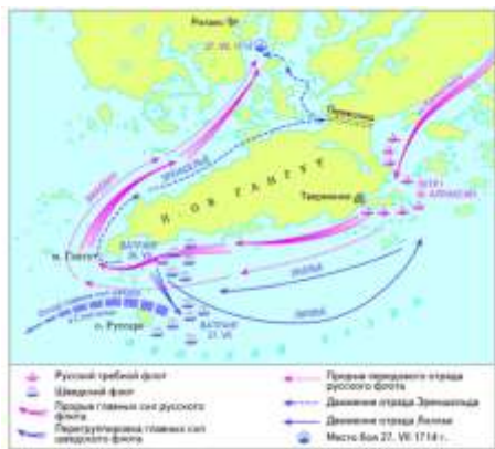
Карта битвы при Гангуте

Благодаря этому плану русским войскам удалось бы освободить флотилию из блокады.