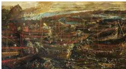
Тинторетто. Битва при Лепанто

На правом фланге турок все сложилось еще интереснее.